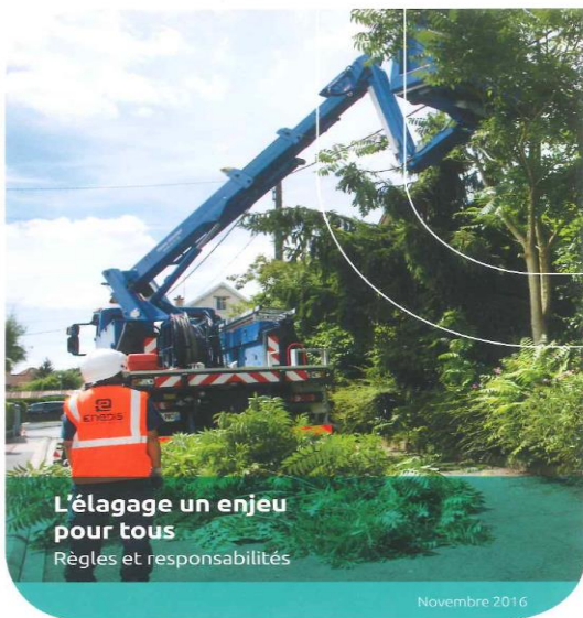
L'élagage un enjeu pour tous Règles et responsabilités